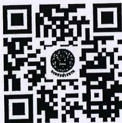
ดาวน์โหลดเอกสารแผนฯ

สำนักบริหารจัดการน้ำและอุทกวิทยา โทรศัพท์ โทรสาร ๐ ๒๖๖๙ ๒๑๕๓